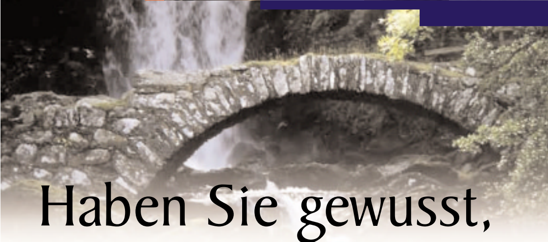
Ruined bridge, Glenlyon